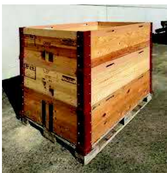
Paletten mit max. 3 Rahmen (wenn nötig mit Auskleidung)