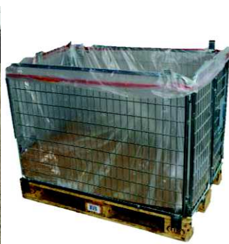
Gitterboxen (wenn nötig mit Auskleidung)